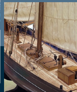
Benoît LE ROUX