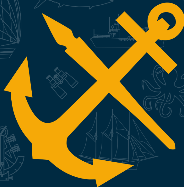
Conception : Christian LEROY www.cld.fr

Ouvert mardi, jeudi, vendredi 14h30-18h30 mercredi et samedi 10h-12h30 et 14h-18h Fermé dimanche et lundi